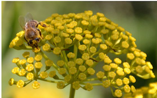
Bupleurum fruticosum Buplèvre ligneux Famille des Apiacées

Courant dans les garrigues, il fleurit au mois de juillet à une période où il y a peu de fleurs. Arbuste de 1,50 à 2m de hauteur voire plus. Peut être utilisé comme petite haie ou à l'arrière plan d'un massif. Il est visité pour son nectar par d'innombrables insectes, mouches, abeilles solitaires, guêpes, bourdons et bien sûr par les abeilles.