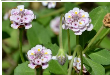
Lippia nodiflora ou Phyla nodiflora Phyla à fleurs nodales Famille des Verbenacées

C'est un excellent couvre sol, alternative au gazon trop exigeant en eau. Longue floraison de juin à août. Ne demande aucune tonte et très peu d'arrosage. Prudence si l'on marche pieds nus, car très visité par les abeilles qui récoltent pollen et nectar.