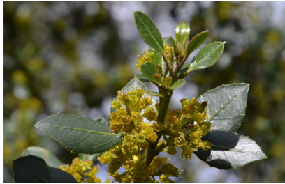
Rhamnus alaternus Alaterne Famille des Rhamnacées

Visité par de nombreux pollinisateurs, il produit du pollen et du nectar.