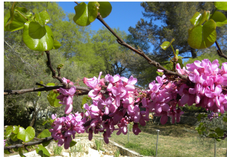
Cersis ciliquastrum Arbre de Judée Famille des Fabacées

Très visité par les abeilles, produit du nectar et du pollen en abondance.