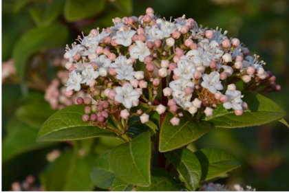
Viburnum tinus Laurier tin Famille des Adoxacées

Je ne vais pas vous citer toutes les plantes mellifères de printemps, la liste serait trop longue, mais voici parmi les essentielles les moins connues :