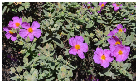
Cistus albidus Ciste cotonneux Famille des Cistacées

Petit arbrisseau en boule, ligneux sur sa base, herbacée sur les nouvelles pousses